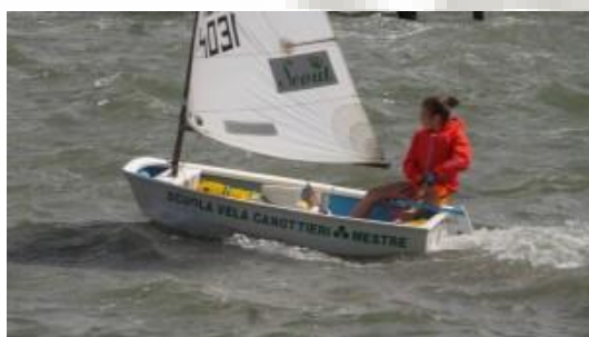
Foto che ritrae un allievo del Corso Optimist 2015 della Canottieri Mestre

L'Optimist è una barca usata sia per la scuola vela come primo approccio alla vela per i bambini, sia per le prime vere regate, che in questi anni hanno formato fior di campioni, timonieri e skipper, tra cui olimpionici e skipper di Coppa America.