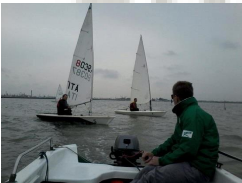
Foto di un Corso Laser della Canottieri Mestre 2015

Il Laser è stato creato con l'idea di permettere ai velisti di andare in acqua in modo semplice e veloce.